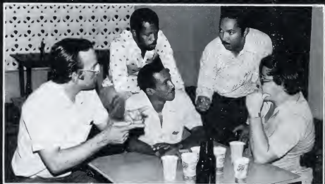
De lerarenopleiding vormde weer een gewild discussiepoint tijdens de ledenvergadering.

— Als nieuwste datum voor de introductie van het Papiamentu is genoemd: begin volgend schooljaar. Worden er nu al voorbereidingen getroffen, wordt er b.v. al gewerkt aan nieuwe schoolboekjes?